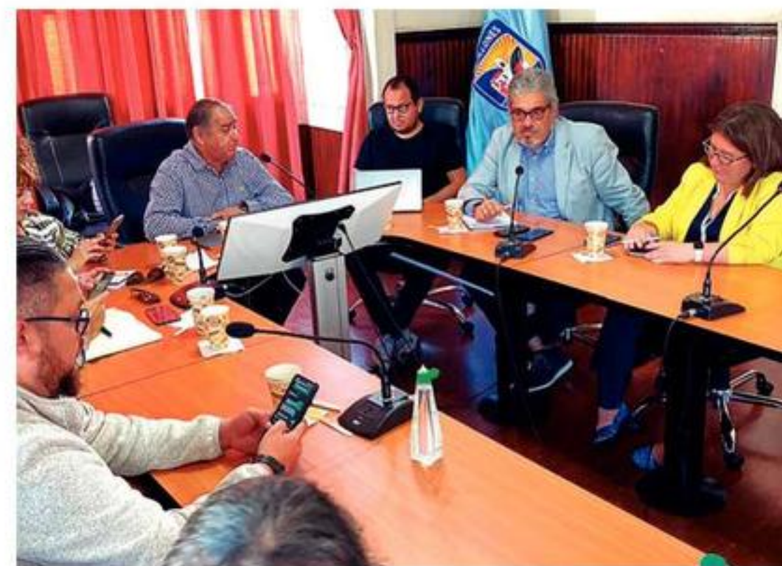
EN LA REUNIÓN PARTICIPARON AUTORIDADES Y PESCADORES.