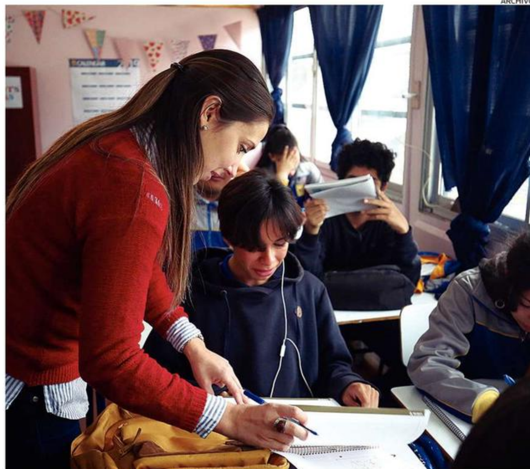
EL PROGRAMA PARTIRÁ EN JUNIO Y LAS CLASES COMENZARÁN EN AGOSTO PARA LOS EDUCADORES Y DIRECTORES.