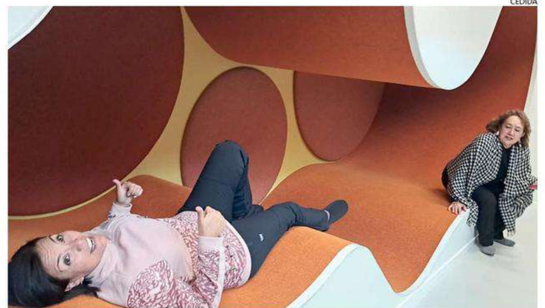
DOCENTES DE LA REGIÓN HICIERON LA PASANTÍA EN FINLANDIA.

to que trabaja desde el año pasado con más de 260 profesores en forma presencial y online, a fin de incentivar la innovación y el liderazgo al interior de las