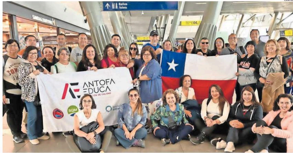
PROFESORES Y DIRECTORES DE 20 ESTABLECIMIENTOS EMPRENDIERON RUMBO AYER A FINLANDIA.

De esta manera, los especialistas europeos capacitarán a la comitiva local y mostrarán en terreno los principales avances en materia educativa. Los mismos expertos visitaron